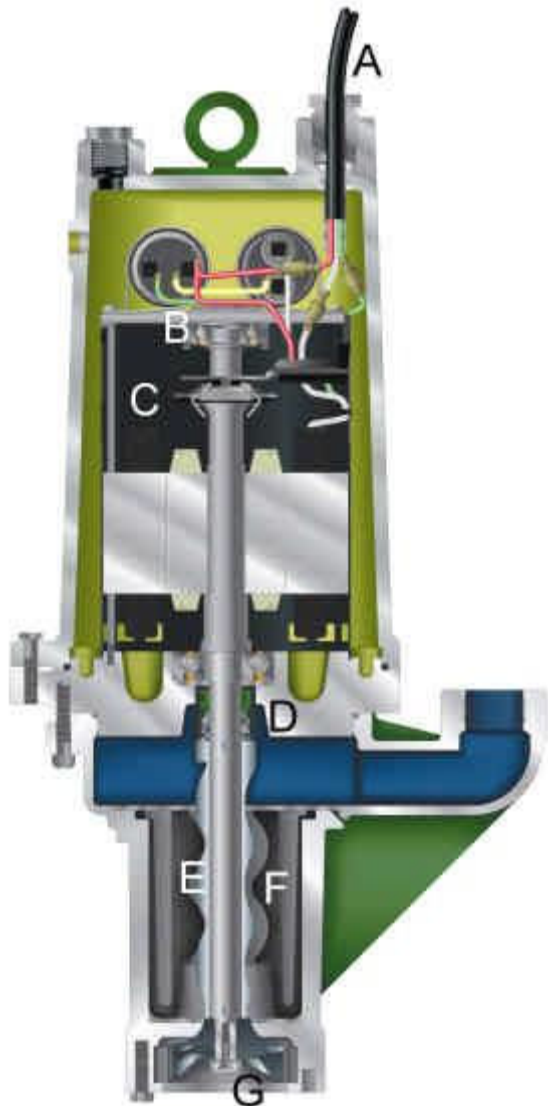
Hydromatic HPD200 50 Hz