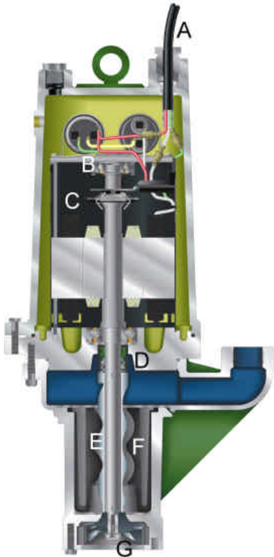
Hydromatic HPD200 50 Hz